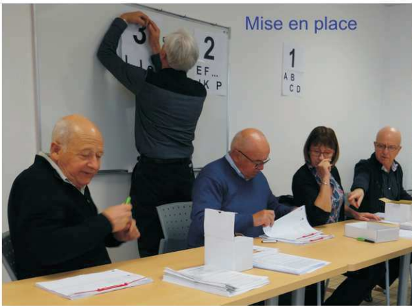
Mise en place