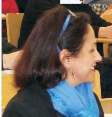
Tous attentifs ...?